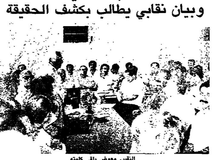
التقيب معوض يلقى كلمته

توقفت امس محكمة الشمال كافة عن العمل، بناء لقرار اصدرته نقابة المحامين، على اثر امتناع المحامين عن حضور الجلسات للمطالبة بكشف قضية مصرع المحامي توفيق الاسعد، التي وقعت منذ حوالي عشرة ايام في مكته بباريس، حول تحديد واضح من قبل الاجهزة المختصة لاسباب الوفاة وملاساتها.